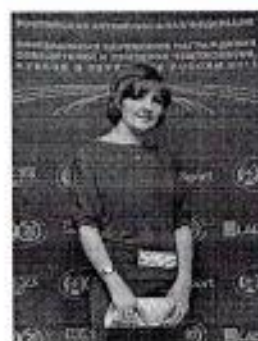
Судья при участниках