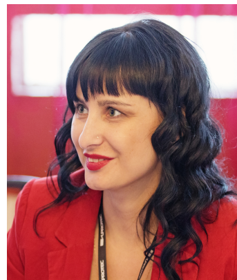
Помощник Коменданта Парка сервиса