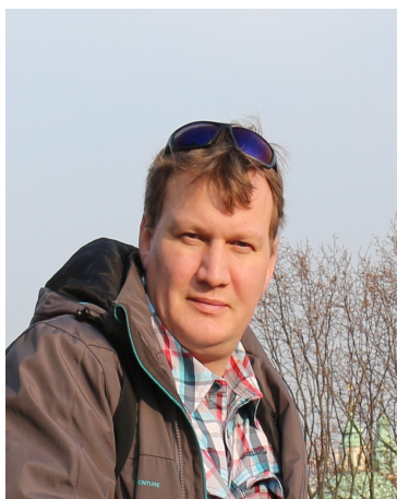
Комендант Парка сервиса