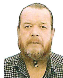
Комендант Парка сервиса (бивуака)