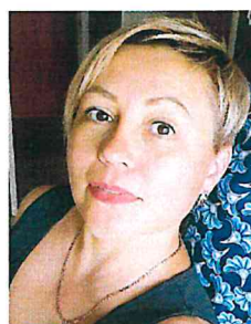
Офицер по связи с участниками